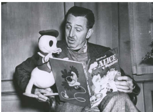
วอลต์ ดิสนีย์ (Walt Disney)

“สมบัติที่ซ่อนในหนังสือ ...มากมายเสียกว่า... สมบัติของโจรสลัดทั้งเกาะรวมกัน”